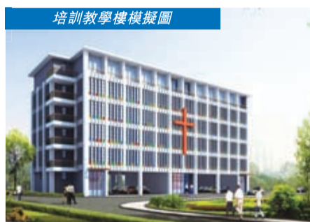
培訓教學樓模擬圖

廣西區人口之多位列全國第九，但區內仍然沒有聖經學院或神學院，故此，新建的培訓教學樓肩負