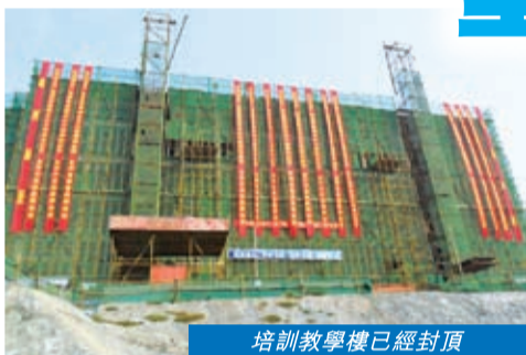
培訓教學樓已經封頂